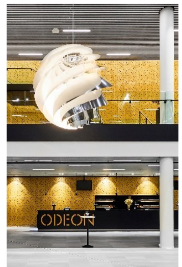
Odeon Odense lægger hus til Danske Kræftforskningsdage d. 30.-31. august 2018