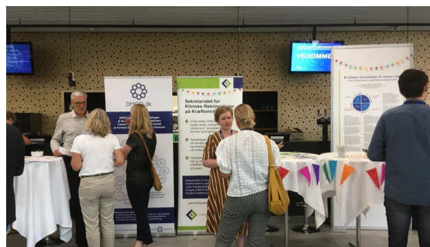
Retningslinjeseekretariatets stand ved Danske Kræftforskningsdage 2019.